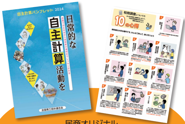
民商オリジナル 自主計算パンフレット